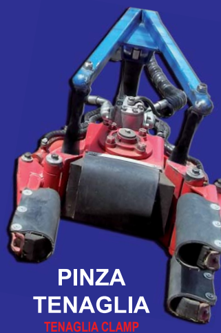
PINZA TENAGLIA TENAGLIA CLAMP