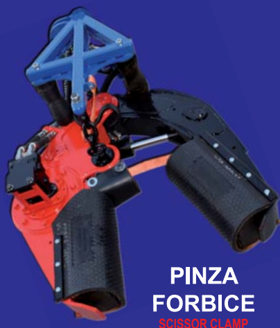
PINZA FORBICE SCISSOR CLAMP

PINZA "NEW" MOUNTED ON A SMALL ESCAVATORE